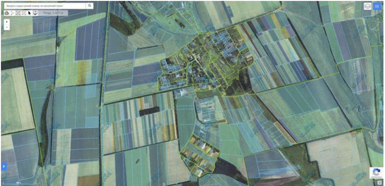
с. Іванівка орієнтовна площа – 2,000 га