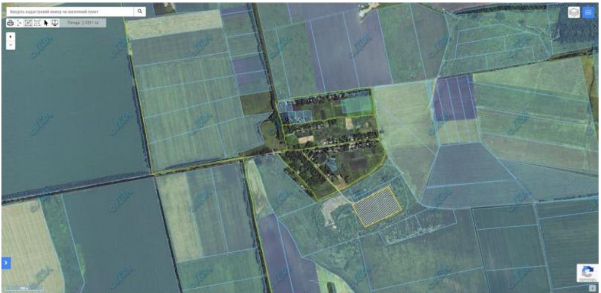
с.Олександрівка орієнтовною площею 2,30 га